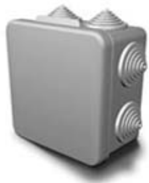
Рис. 1. Корпус фотореле.